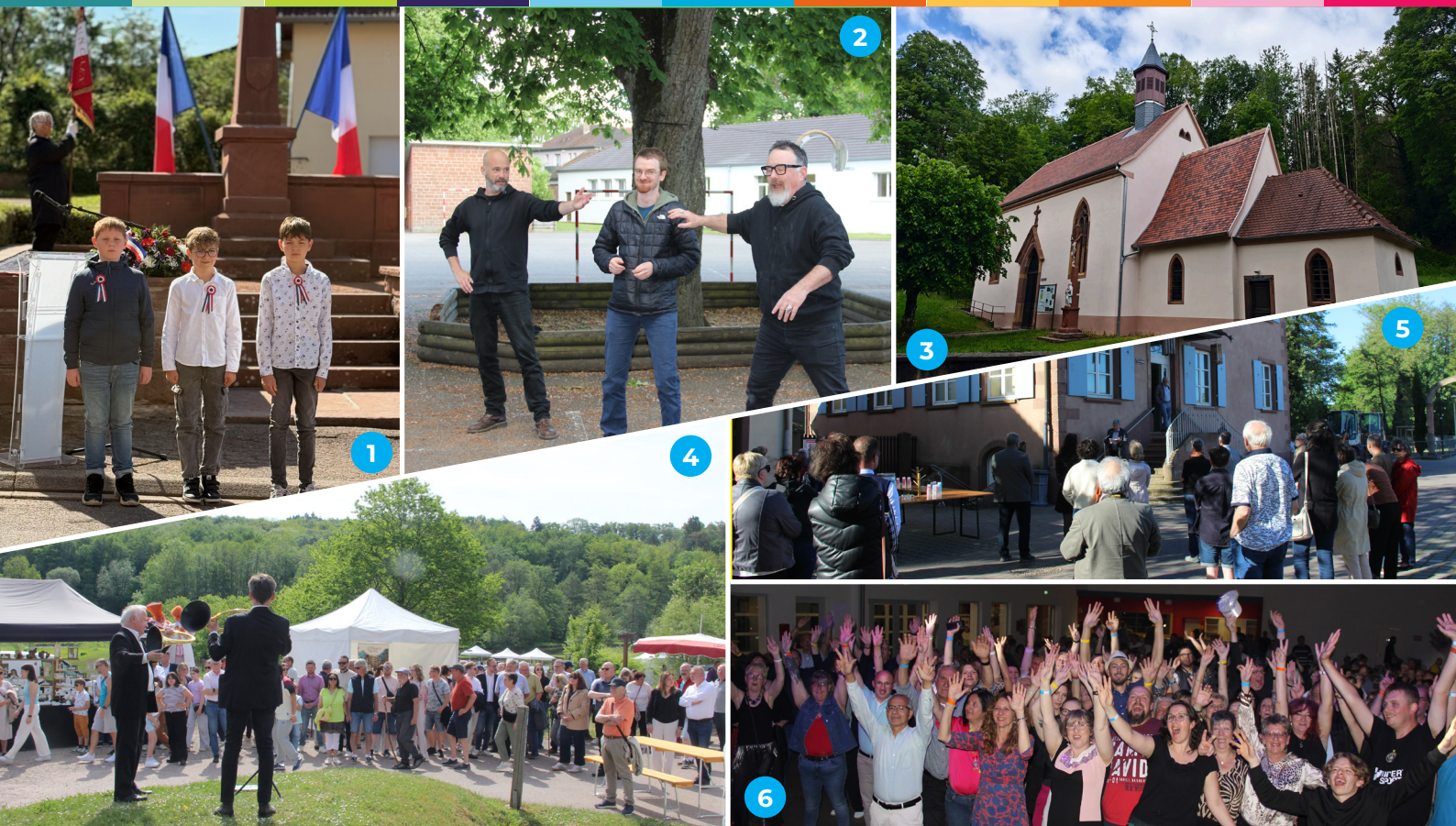
1. Cérémonie du 8 mai à Nehwiller - 2. Spectacle "Germinal", 16 mai - 3. Bénédiction de la Chapelle de Wohlfahrtshoffen restaurée, 23 mai - 4. Flâneries et Découvertes autour du Plan d'eau, 10 mai - 5. Vernissage de l'exposition temporaire du Musée, 29 avril - 6. Soirée 80's & 90's du FCER, 16 mai.