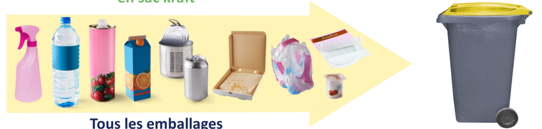
Tous les emballages vides, en vrac, non imbriqués