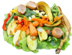
Épluchures de fruits, légumes et coquilles d'œufs