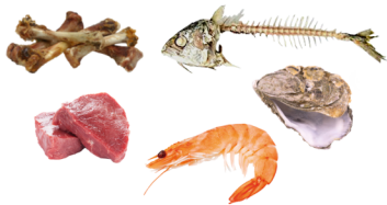
Os, viandes, poissons et produits de la mer