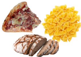
Restes de repas, pains et céréales