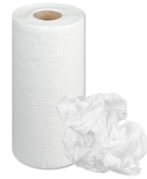
Serviettes en papier