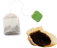
Marc de café et sachets de thé