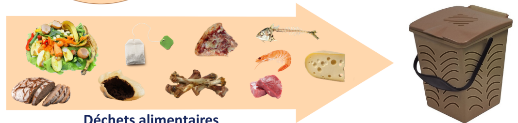
Déchets alimentaires en sac kraft

Nos déchets alimentaires ont de la valeur. Le SMICTOM propose une solution complémentaire au compostage pour valoriser les déchets comme la viande, les produits laitiers et de la mer, difficilement compostables.