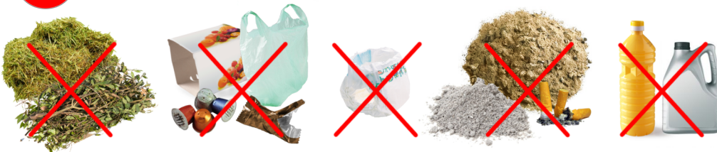
Déchets verts, emballages, couches, cendres, litière, huiles