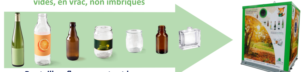
Bouteilles, flacons, pots et bocaux dépôts entre 8h et 20h