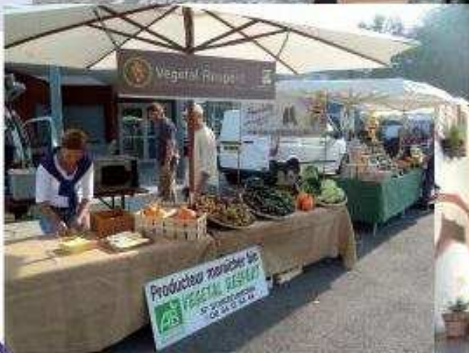
Marché Transfrontalier, 25 septembre