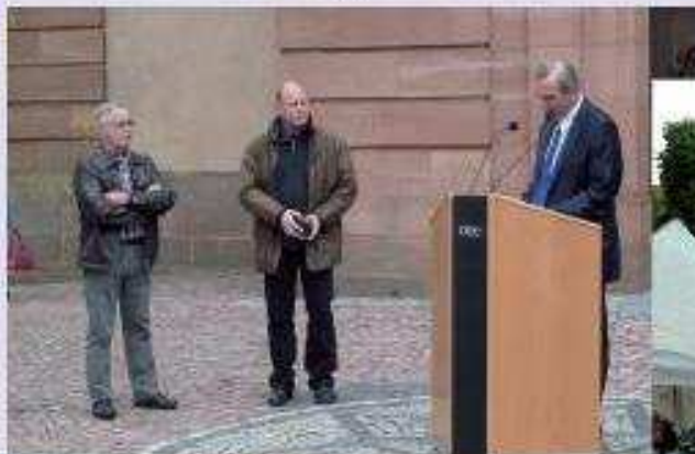
Inauguration du Carillon de l'Europe, 18 septembre