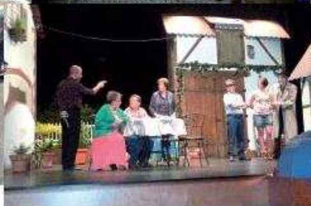
« Mord im Hienerstall » par le TARN, du 5 au 20 novembre