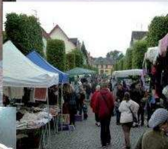
Marché aux puces des Pompiers, 18 septembre