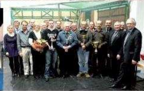
Exposition avicole 19 et 20 novembre